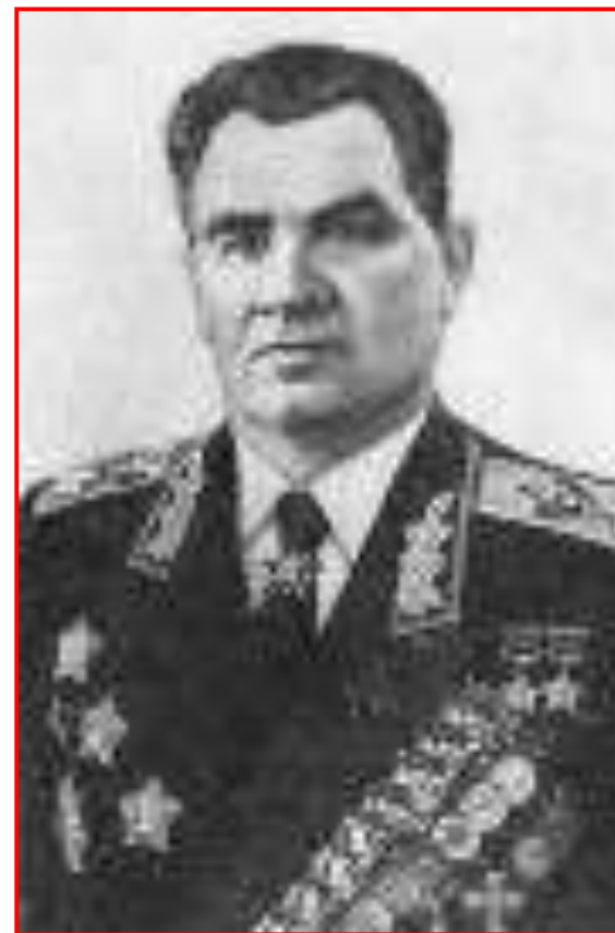
В. И. Чуйков, командующий 62-ой армией

«...Казалось, что всё живое должно было погибнуть среди этого моря огня, среди непрекращающихся бомбёжек, что человеческие нервы больше не способны выдержать этого адского напряжения. Но воины выдержали. Несокрушимой стеной стояли они на своих рубежах...»