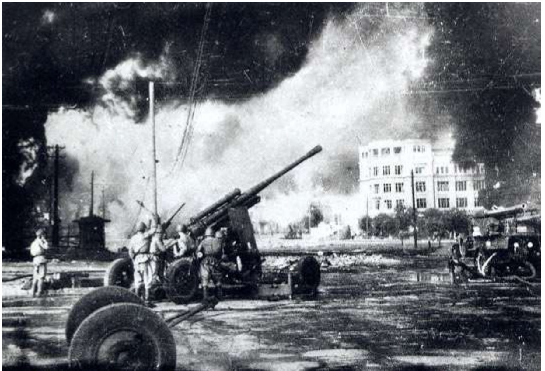
Бои на улицах города, лето 1942 года