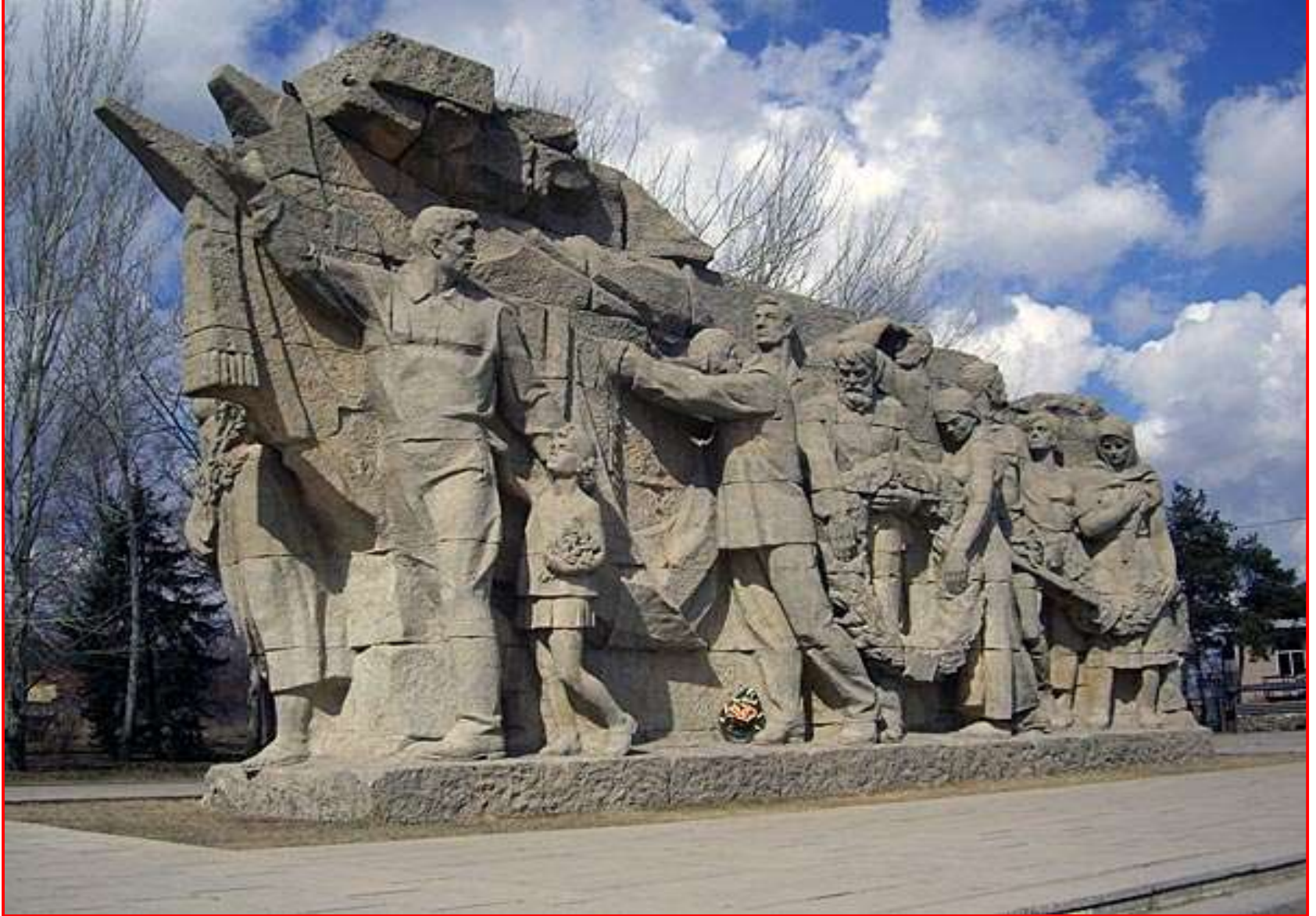
У входа на Мамаев курган Скульптура «Память поколений»